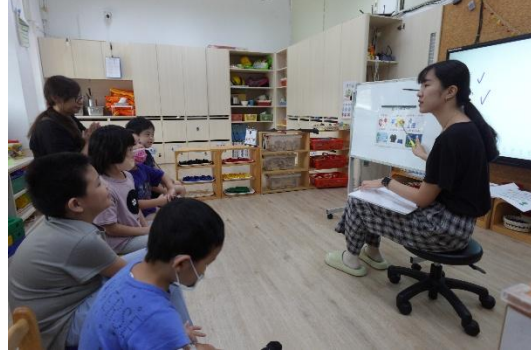
▲唸兒歌前的圖卡認識