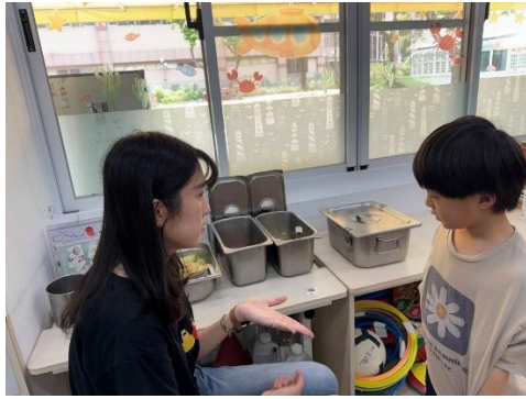
▲ 盛飯時利用圖卡進行表達