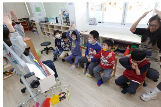
▲練習兒歌歌詞的對應動作

剛開始加入動作確實引起孩子高度興趣，但也出現一些挑戰，像是有些孩子會只做動作而不說話，有些孩子則因動作太多記不住而感到混亂，語言表現