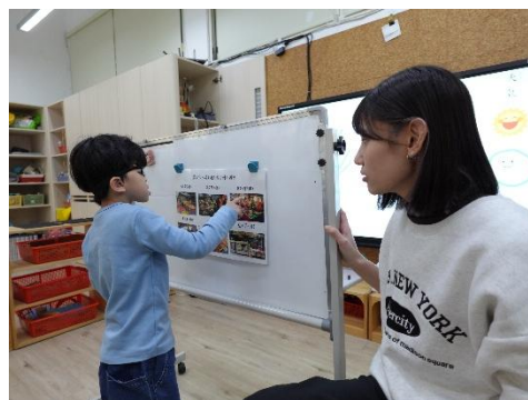
▲利用圖卡認識各種商店