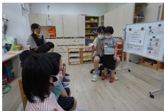
▲孩子進行「你來比、我來唸」的遊戲