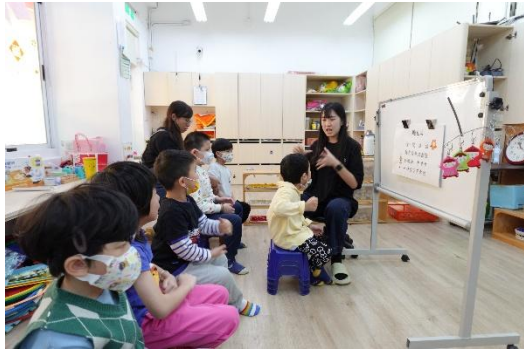
▲一對一練習唸句子