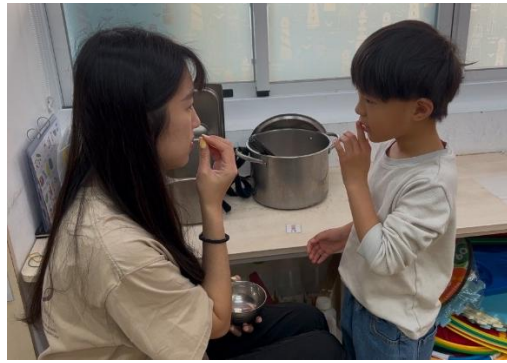
▲ 加入手勢提示練習