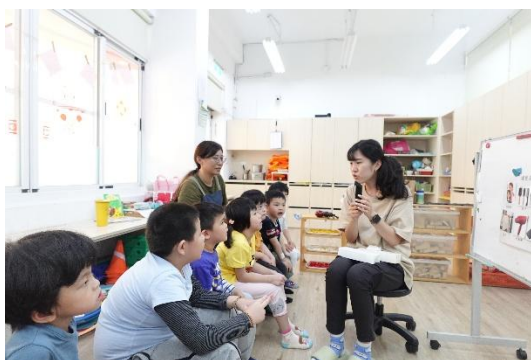
▲帶孩子認識理髮店的物品

因此在後續的調整中，老師進一步加入「唸出句子→孩子說出意思」的口語互動環節，並設計簡單問題作為引導，例如「你剛剛唸到什麼水果？」、「你喜歡吃哪一種水果？」等，協助孩子將兒歌語句轉化為生活經驗。老師也強化了語句與情境的結合，例如：讓孩子實際操作「買水果遊戲」，使用兒歌中學到的語言進行對話，讓語意的理解與應用更自然發生在遊戲與互動中。